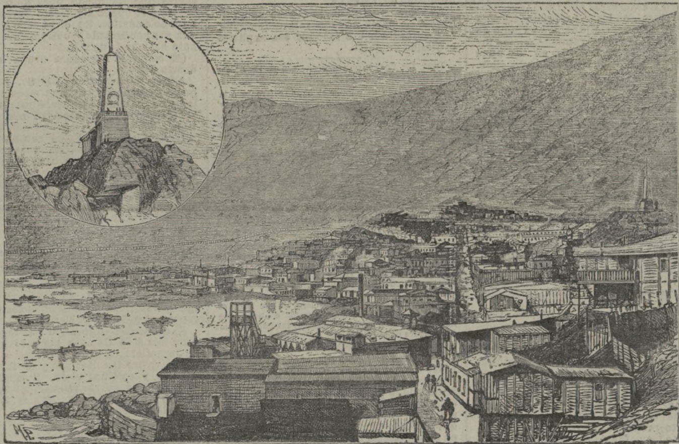
Vista de Pisagua.—Chile.

ponerlo en tela de juicio, toda vez que esta formada sobre la base de la donación de Mesonero Romanos, y claro es que las obras que aquel ilustrado escritor adquiriera para su estudio vendrían a satisfacer las necesidades de un talento como el suyo; mas teniendo en cuenta las adiciones del autor de El antiguo Madrid y Escenas matrimoniales , también está claro que los fondos donados por él han de ser, en su mayoría, de historia y de bella literatura, caracteres, no inútiles, pero sí de secundaria importancia en la gestión de los intereses de esta villa.