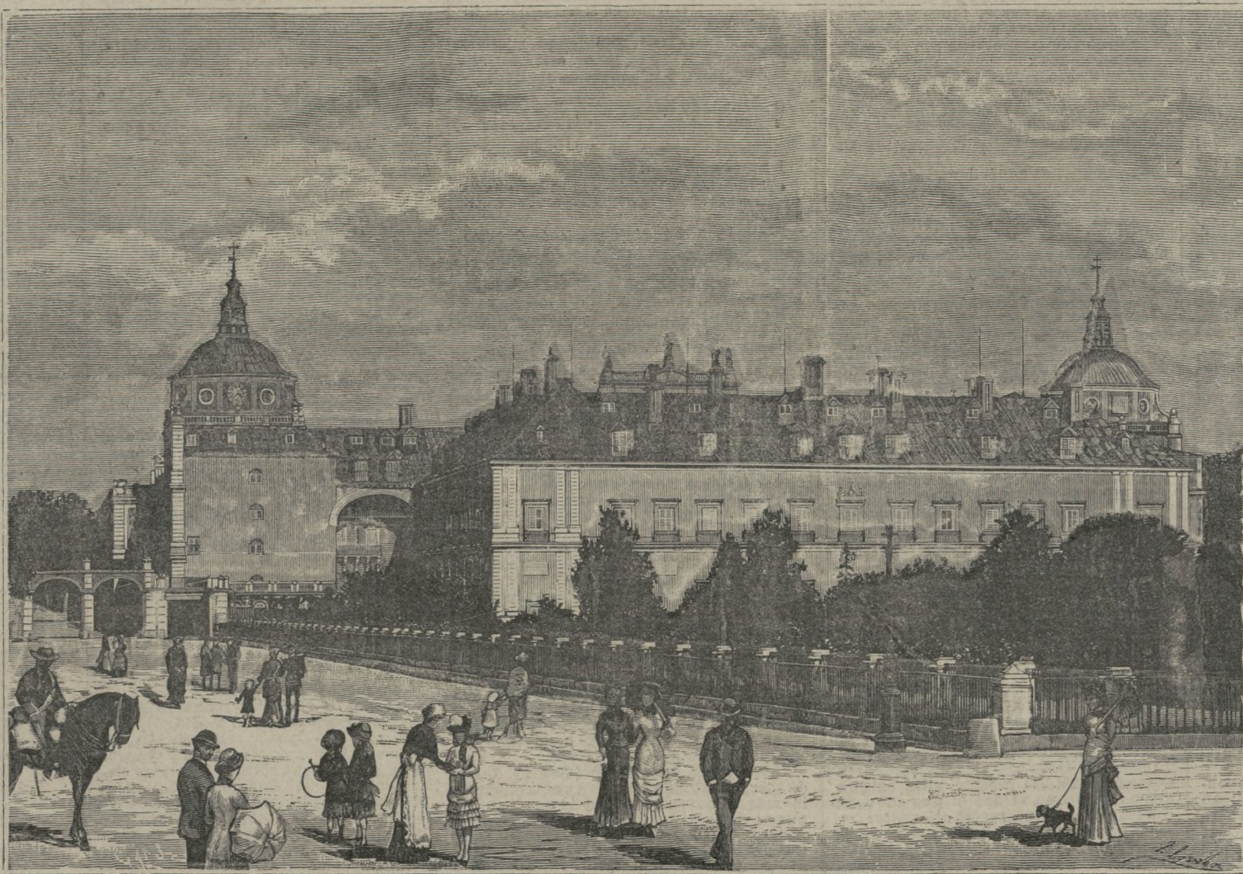
Vista exterior del palacio de Aranjuez.

de gracia se añade que Pilarita cantaba como si la doliese el vientre y corrió a auxiliarse un novio Babanete p'andando a la tuta suegra que cayó a plomo sobre don Teleforo, quien, vomitando las oblas que se había comido en la oficina, se agarró al gato haciéndole saltar a las narices de Pilarita, por los cuales sustos y lesiones necitaron los tertulios cataplasmos de cebolla a los vasos y un flete universal de alcohol de 40 grados... ¡el cabosé! y boca abajo todo el salero y la vie cómica y la Giralda inclusive, que ahí está ya hecho y derecho un autor de circunstancias!