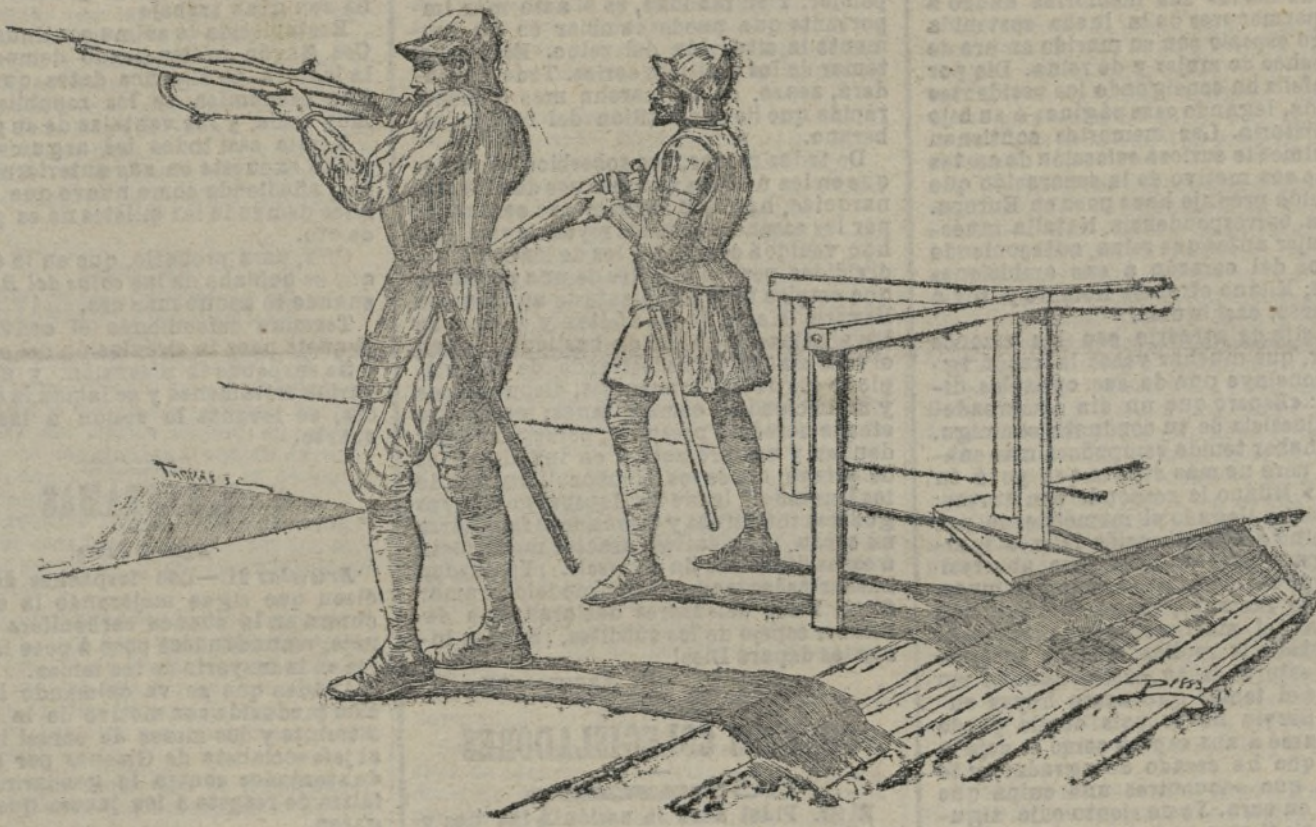
Escopetero y ballestero.

color, pero de manera que ofrece en sus obras libro y palpitante el sentimiento mismo a que debe el ser. El Sr. Arvilés presenta una acuarela El estancue del Retiro .