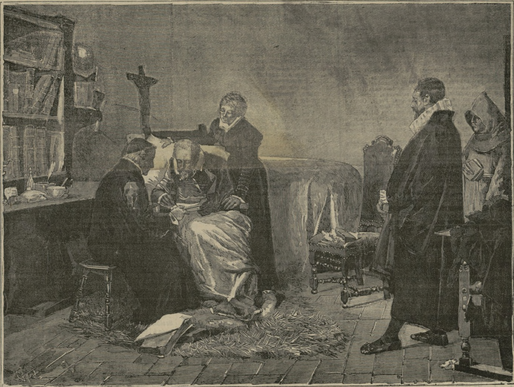
Cervantes, escribiendo la dedicatoria de Persiles.