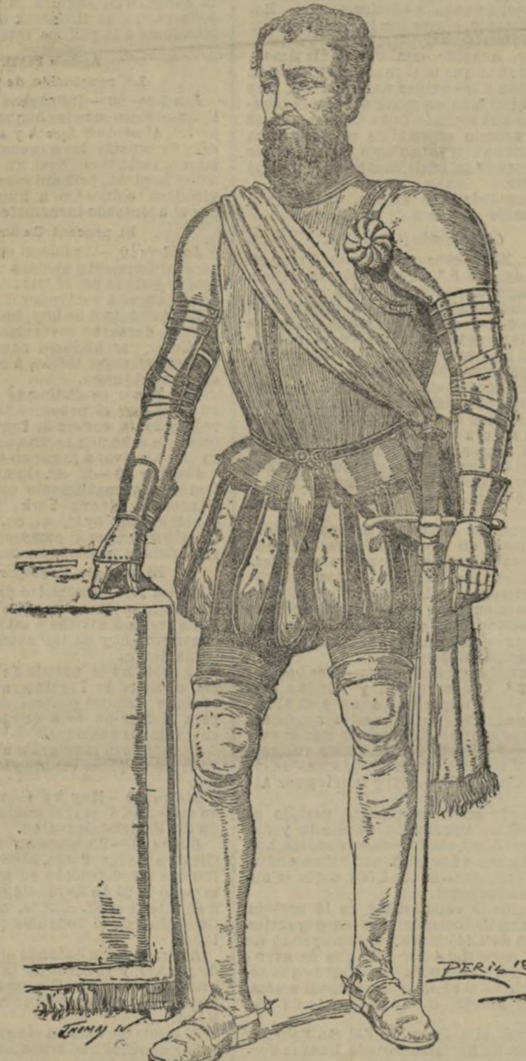
El marqués del Vasto.

D. Alfonso Dávalos, marqués del Vasto, fué hijo de un hermano del celebrado marqués de Pescara, siendo toda esta familia de origen castellano, pero establecida y afincada en Italia desde los tiempos de don Alfonso el Viejo. En el reino de Nápoles la familia del Vasto luchó contra los franceses bajo las órdenes del infanzonado don Fadrique; más tarde también prestaron valiosos servicios guerreros al rey don Fernando el Católico, recibiendo D. Ildefonso Dávalos, en premio de su esfuerzo, el título de marqués del Vasto. Educado en la brillante escuela de los capitanes españoles del Renacimiento militar, y sirviendo a las órdenes del marqués de Pescara, su tío, el joven D. Alfonso dió á conocer bien pronto sus talentos, contribuyendo a la victoria de Pavía y tomando una parte activa en las campañas del Milanesado y del reino de Nápoles. En el sitio de esta plaza y en el combate que riñó la flotilla de Moocada con la escuadra de Doris, Vasto, que combatió como un león, tuvo la desgracia de caer prisionero; pero este acontecimiento influyó benéficamente en el porvenir de la guerra, porque el marqués no sólo consiguió su libertad, sino que además logró con su diplomacia y habilidad avisar el reencuentro de Francia, consiguiendo atraerle á su partido y cambiar de improviso, por este solo