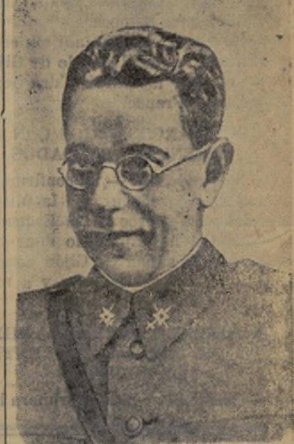
GENERAL MOLA ¡PRESENTE!

licada y se había acordado evacuar a la población civil así como interesar en este asunto las potencias extranjeras democráticas.