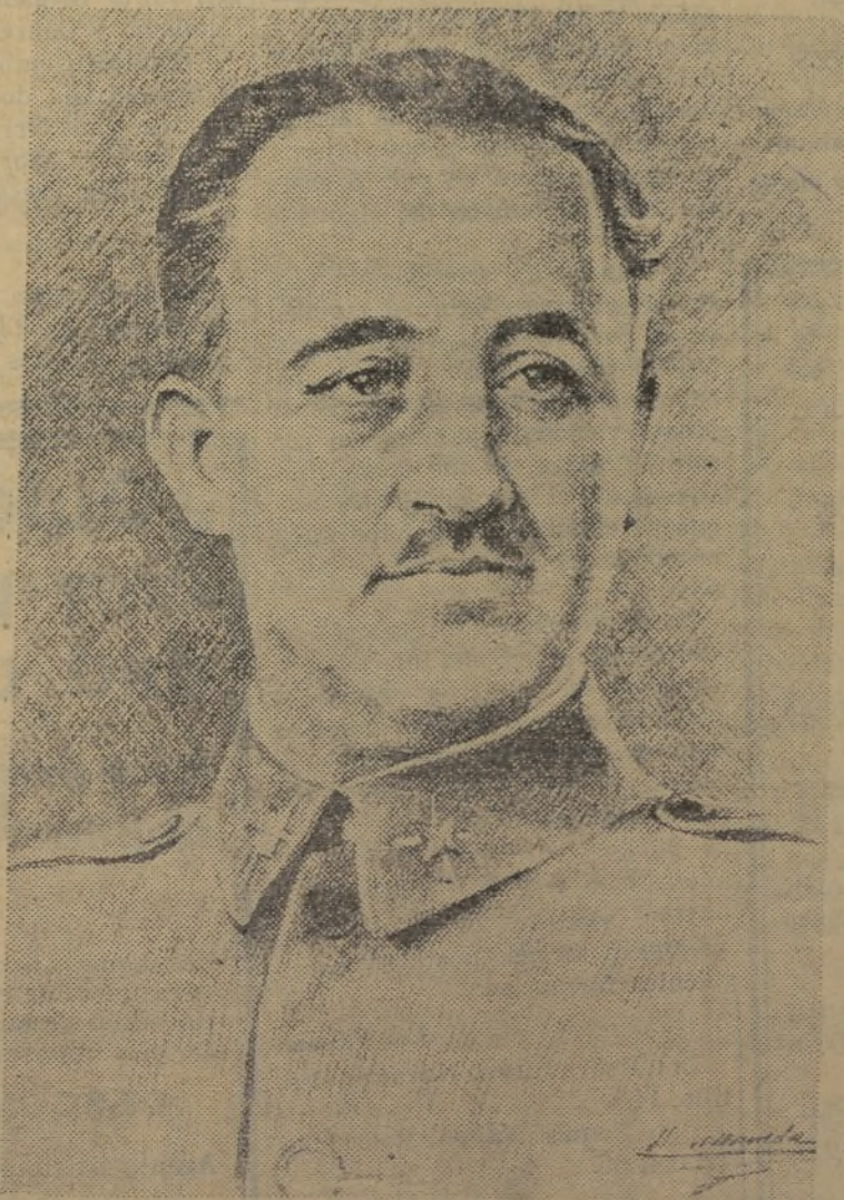
Caudillo, hoy como siempre FRANCO, FRANCO, FRANCO

NO. ES EL HÉROE. ES EL MAGO. ES ESPAÑA. CUANDO LOS TIEMPOS DE HOY SE HAGAN PLASTICIDAD EN LA HISTORIA DE MAÑANA, EL EPISODIO NACIONAL DE ASTURIAS VALDRÁ, POR SI SOLO, TODA LA GRANDEZA IMPERIAL DE UN MONOLITO HISTÓRICO. ANTE ÉL SE PARARÁN LOS OJOS Y LAS MENTES PARA CONTEMPLARLO. SE ARRODILLARÁN LAS GENERACIONES PRÓXIMAS Y EL GRITO INICIAL SE ALZARÁ DEL CORAZÓN A LA GARGANTA Y DE LA GARGANTA AL CIELO: ¡DON PELAYO REVIVE EN FRANCO! COVADONGA —ALMA DE ASTURIAS— ES EL ALFA Y OMEGA DE LA RECONQUISTA ESPAÑOLA.