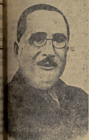
EL GENERAL ARANDA El defensor de Oviedo

Radio Berlín 21. 0'30 — La primera noticia de la rendición de Gijón fue transmitida en la emisora de Radio Berlín. El locutor anunció que Gijón es una ciudad ya desmoralizada, que los soldados estaban huyendo y ya se estaba tratando de negociar la rendición con las tropas nacionales. Ignoraban más detalles, pero