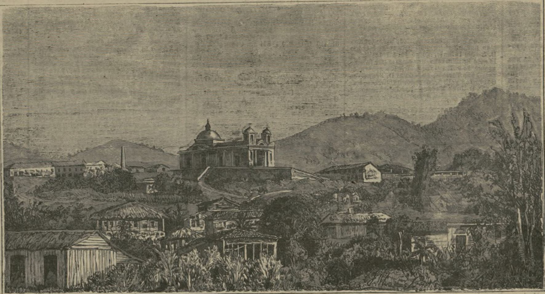
CUBA.—Santuario de la Virgen del cobre.

El paciente se coloca en el terrible sillón y sege con la mano izquierda el electrodo negativo y el positivo con la izquierda. En este momento el operador hace pasar una corriente que va aumentando de intensidad hasta llegar al límite de la tolerancia del paciente, que no suele ser mucha. Manteniéndose en este límite la corriente y se une el extractor al electrodo por el que hasta entonces colocaba sobre el diente para que, bajo la acción de las vibraciones, sea expulsado de la boca. La extracción se efectúa con gran rapidez, y el paciente—a juzgar por lo que dicen los experimentadores—no siente otra cosa que un ligero pique en las manos y abrazos, causado por el paso de la corriente.