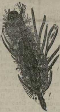
Gusano del Bombix monje en una pequeña rama de pino.