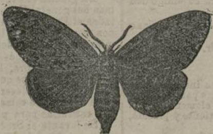
Bombix monje, mariposa hembra.

Por ahora, no podemos aún conocer el alcance de su labor política ni calcular si el foco de civilización que ha sabido mantener vivo en el Sudán llegará ó no a salvarse definitivamente de quedar apagado. Conocidos son los vastos proyectos de confederación africana que Stanley ha llevado al Congo superior: la provincia equatorial está destinada en su pensamiento a servir de base para realizarlos, y en un día no muy lejano habremos de tocar los resultados de esta grandiosa concepción para cuyo éxito habrá trabajado Emin-Bajá más que ningún otro.