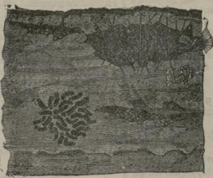
Crisálida, huevos y gusanos del Bombix monje