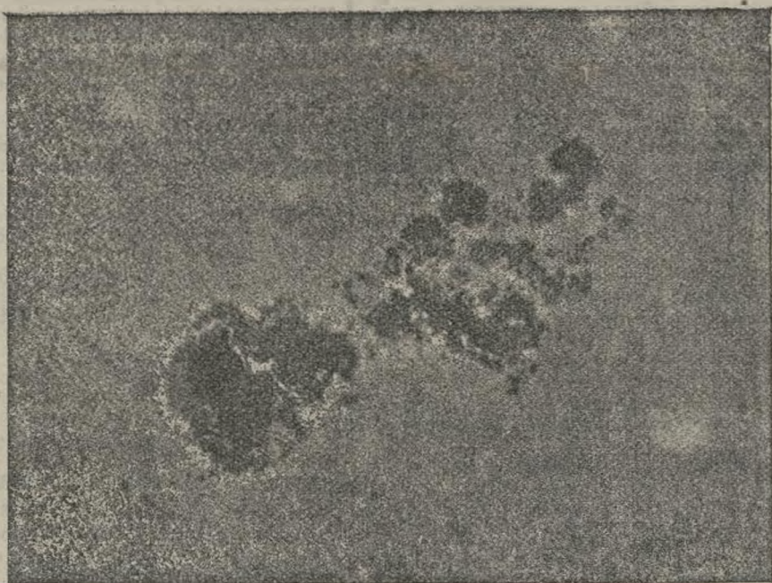
Fotografía de las manchas solares.

Quiero decir que no es a quien me dirijo; pero quisiera que sea, Dios ó mortal, sienta no co-