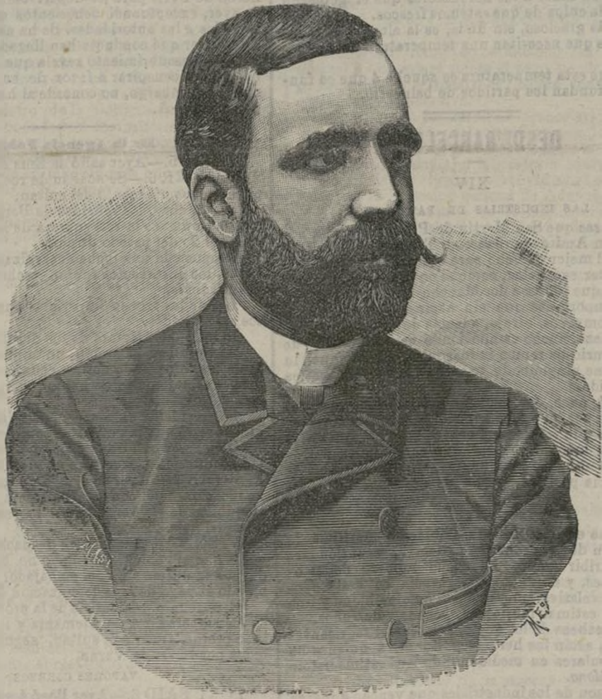
D. José Canalejas y Méndez.

Con este objeto mandó construir, además de lo que hoy se llama Universidad, las casas inmediatas, la calle de Librerías y parte de la de Santiago, el Co- legio de San Pedro y San Pablo, los de San Enge- nio y San Isidoro, para gramáticos; los de Santa Balbina y Santa Catalina, para filósofos y el Gran Colegio Trilingüe. Tres sitios de recreo y esparci- miento para los colegiales, el de San Tey, Aldehue- la y San Toros, cuyo castillo reparó y que ha sido