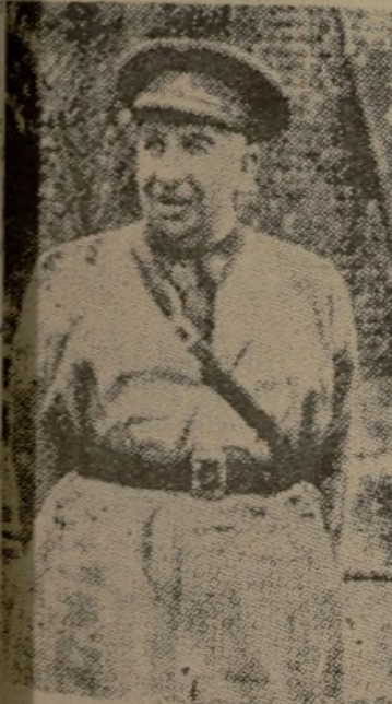
Excmo. señor general divisionario don Luis Orgaz Yoldi, que actualmente se halla entre nosotros.

La Nueva España, por serlo, ha de ser empresa de todos y para todos. Y esa es la España que renace bajo su signo de Catolicidad y de Justicia Social.