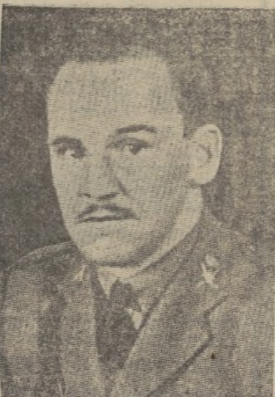
+ GENERAL GODED

Venganza no, justicia sencillamente. — Falta perspectiva para juzgar de nuestra salvación, porque, son tantos y providenciales los sucesos que nos parece imposible que nuestro tiempo haya podido encauzarse siguiendo rutas de firmeza esplendorosa. Todas las mentiras de la propaganda enemiga no ahuyentarán jamás de nuestro recuerdo aquel espectáculo de Madrid, en las noches y madrugadas de Julio, Agosto y Septiem-