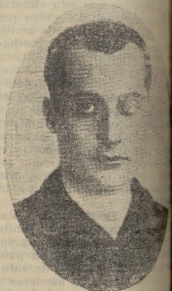
JOSE A. PRIMO DE RIVERA