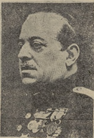
+ GENERAL SANJURJO

a leer el Parte Oficial, el diálogo humorístico y se reproducirá la alocución del Generalísimo en francés, inglés, alemán, italiano y portugués. (Hora local, una hora menos).