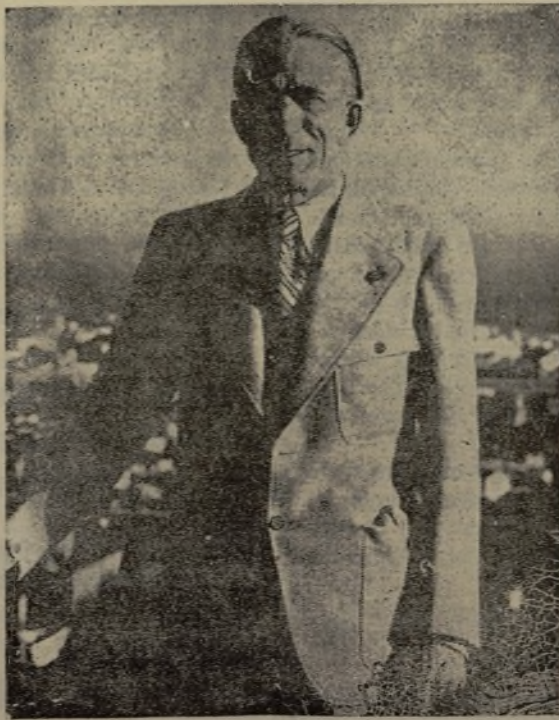
El sabio Doctor Goyanes, gloria de la medi- cina española que el domingo, en el homena- je a S. S. el Papa, desarrolló magistralmente el significado místico-religioso de la pintura del Greco.