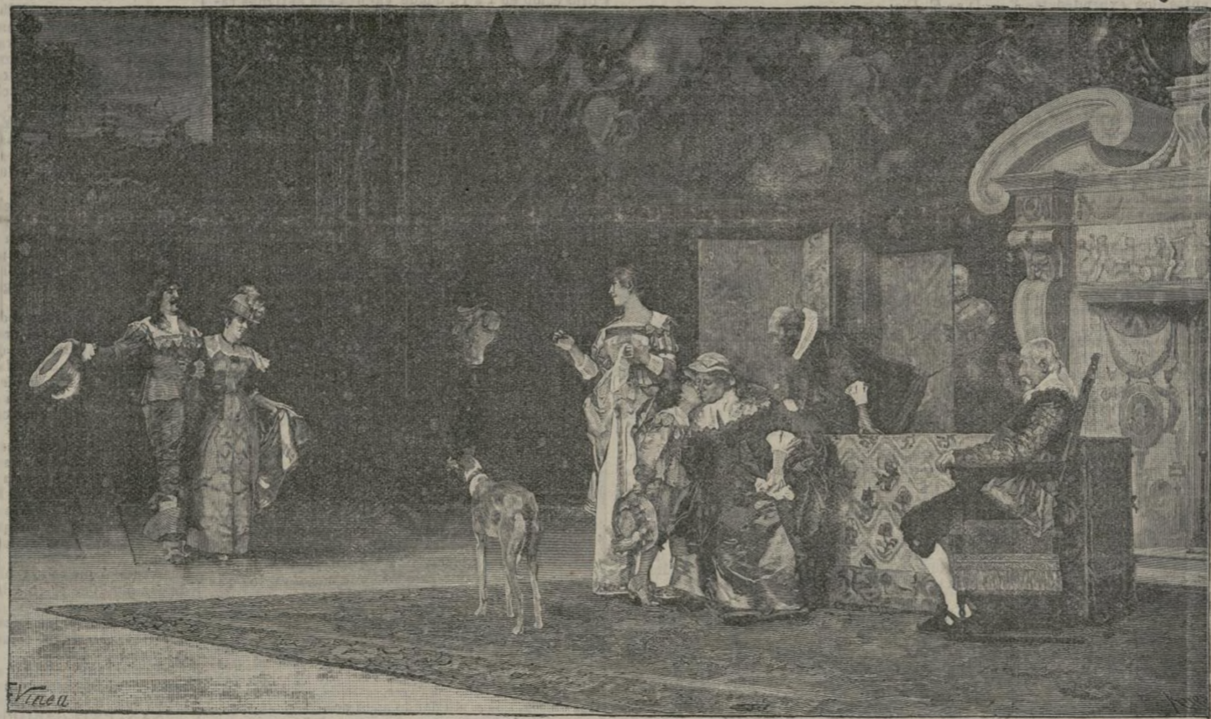
La visita á los abuelos. (Cuadro de Francisco Vinea.)

—¡Sne ve- ría!... —¡A ondef... —A orger ca- racoles... —¡Mia que va á diluviar!... —¡Pus por esol... ¡Te pien- sas tú que por mucho que cha- parrée no va á salir hoy el sol entrando la ca- ñicula!... —¡Té razon pufiol... No me acordillaba yo de esa señoral... Y sin más requiriorios la alegre turba de chicos que jugaba á la peonza en la plazoleta de la fuente se unió al levantisco peloton de galopines que bajaba del pueblo, y todos juntos, despañados, puer- cos, decalcos, en mangas de camisa, jugando al toro sin pararse, tirando piedras á los olivos, ale- gres y bulliciosos tomaron por la senda de la hoz, de crillar las tierras de sembradura, en las que se esparcían á la desfilada las mozas del lugar para concluir con no poca algezata la obra de la hoz, mientras las hormigas, deslizándose á la ohita ca- llando por entre las esñas de la mies se llevaban há- cia casa lo más grande del rastreojo.