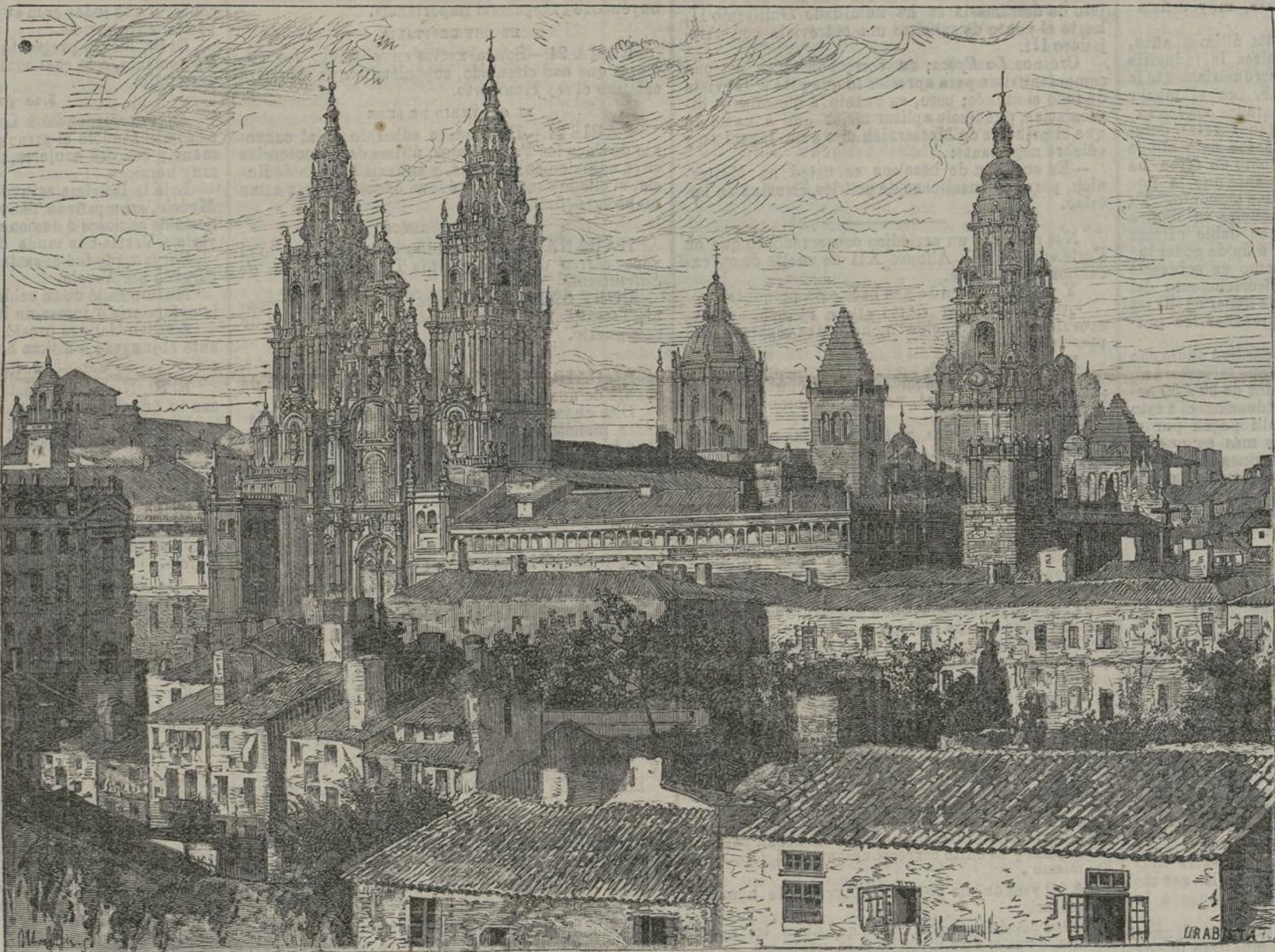
LA CIUDAD DE SANTIAGO