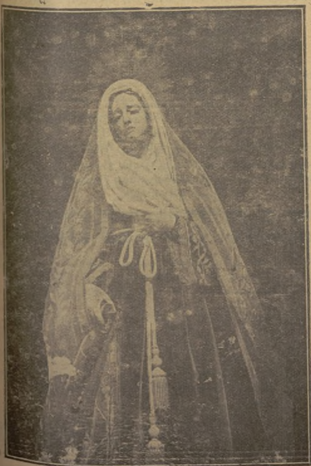
La Madre Dolorosa que hoy recorrerá las calles de nuestra ciudad, partiendo de la iglesia de Santo Domingo.

Salamanca, 12 de Abril de 1938. (II Año Triunfal).