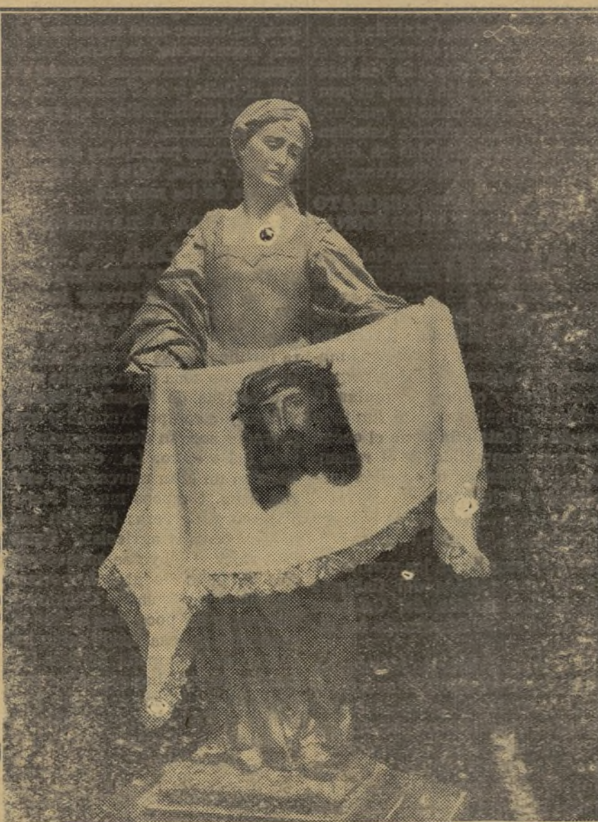
En el camino de la Amargura, la Santa Verónica consuela a Jesús enjugando su ensangrentado Rostro.

Esta ceremonia se celebra en nuestra Catedral desde esta noche. Durante el canto de Láudes se efectúa por tres capitulares una ronda o inspección por el templo con velas encendidas, y al terminar el canto del "Benedictus" y antifona correspondiente, apagadas todas las velas del templo y 14 del tenebrario, que está delante del Coro, se toma la última vela encendida del tenebrario y se conduce hasta el altar mayor para ocultarla debajo de él por la parte de la Epístola, mientras se canta en el Coro el verso que empieza: "Cristo se hizo obediente por nosotros hasta la muerte..." Luego se reza el salmo "Miserere" y terminada la oración que le sigue, se produce el estrépito hasta que la vela encendida se saca de debajo del altar, retirándose todos en silencio.