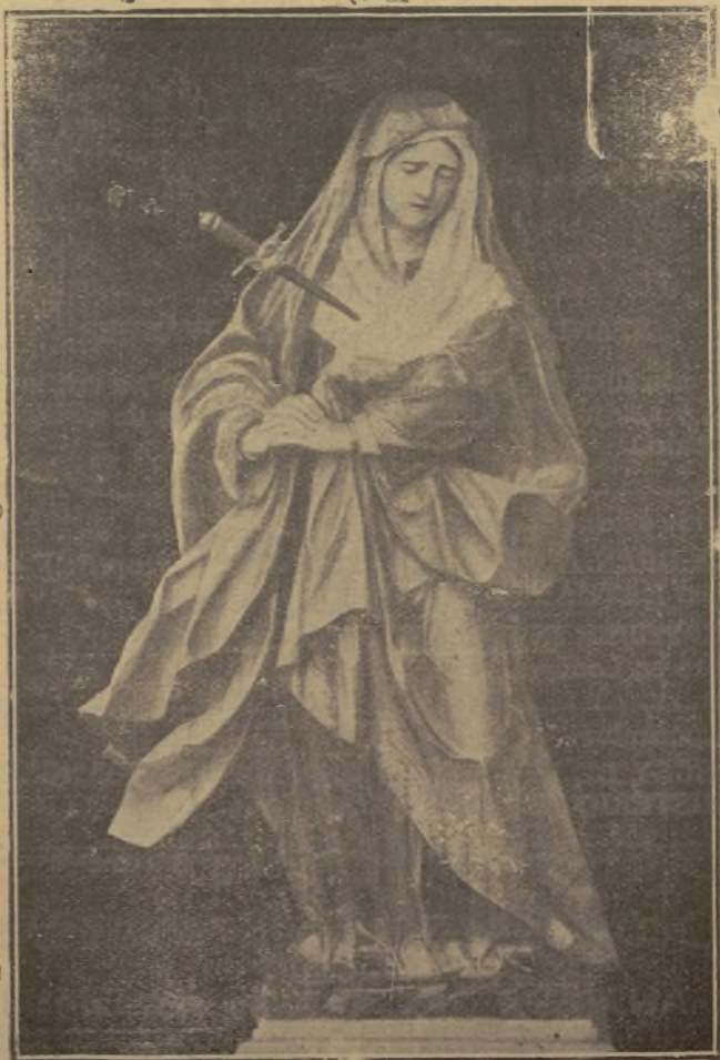
La Madre Dolorosa, obra de nuestro genial imaginero, que al mediodía de mañana saldrá de la Santa Iglesia Catedral