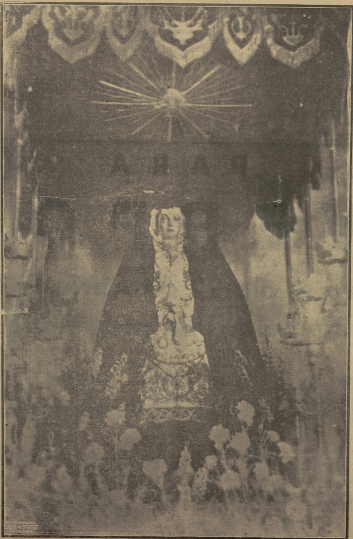
Devota imagen de Nuestra Señora de la Portería que se venera en la iglesia de San Francisco y que el Viernes Santo recorrerá nuestras calles por la tarde y por la noche.