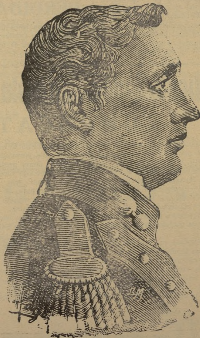
El Caballero Capitán 2.º del 5.º Regimiento del Real Cuerpo de Artillería departamento de Segovia, don Pedro Velarde Santiyan, que por la libertad e independencia de España, salvándola del extranjerismo, dió su vida el 2 de Mayo de 1.808. Capitán Velarde: ¡Presente!