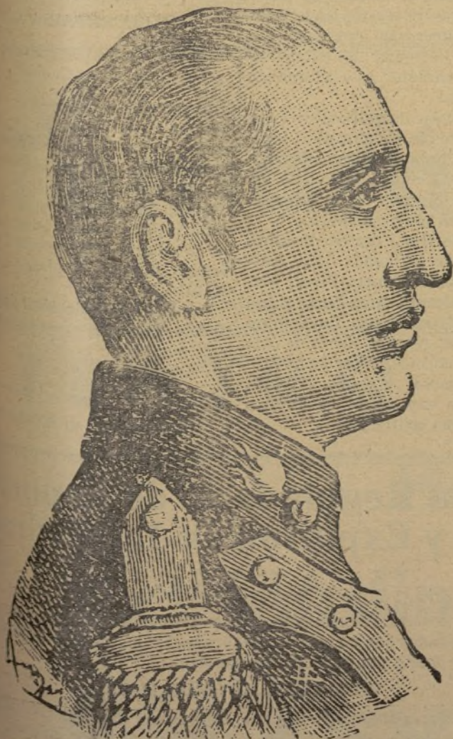
El Caballero Capitán del 3.º Regimiento del Real Cuerpo de Artillería, departamento de Andalucía, don Luis Daoiz, que por la libertad e independencia de España, salvándola del extranjerismo, dió su vida el 2 de Mayo de 1.808. Capitán Daoiz: ¡Presente!