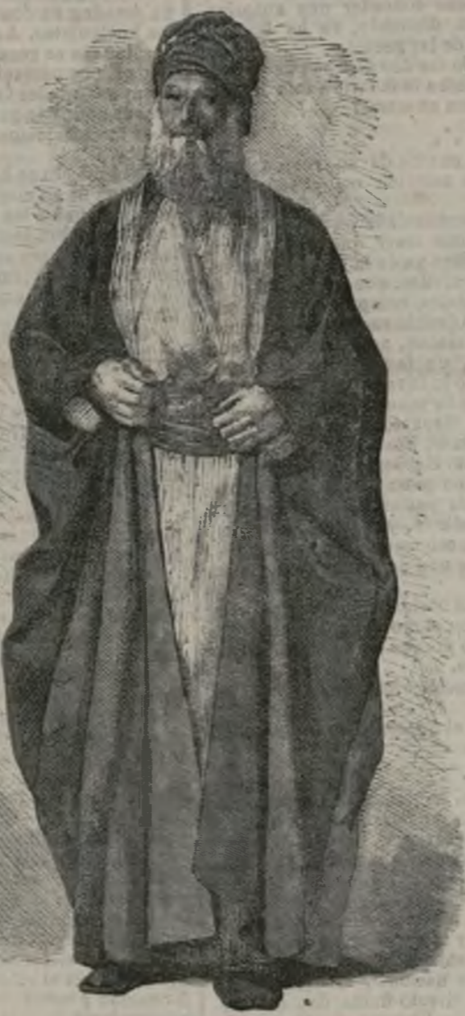
Un judío babilonio.

A pesar de su afeminado aspecto, el rey es un hombre sumamente laborioso. Se levanta a las cinco de la mañana y se acuesta a las ocho de la noche. Todos los negocios de Estado pasan por su mano, y con frecuencia hace viajes a las provincias para oír las quejas de sus súbditos y remediarlas sin pérdida de tiempo.