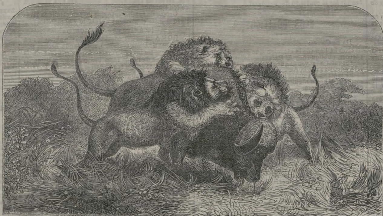
Búfalos y leones.

En esto la mujer del ambulante saltó en defensa de su maltrahado marido, pero en premio á su natural arranque, recibió otra soberana paliza, le arrancaron los ojos, y la dan de puñaladas, á consecuencia de lo cual espiró á los pocos segundos.