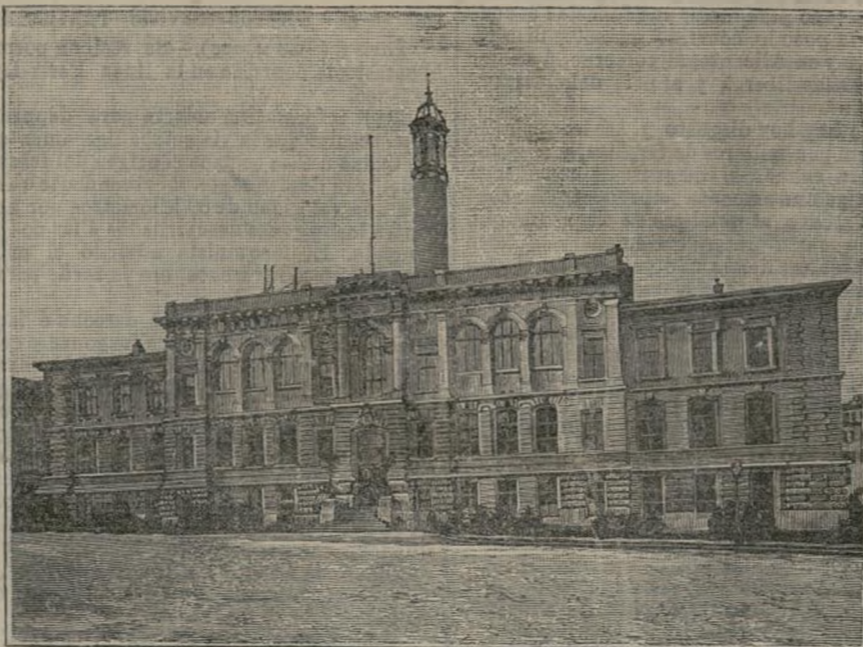
Ginebra.—La Universidad y la Escuela de química.

Meyerbeer compuso la música para una poesía hecha por Luis I, entonces príncipe real, en la cual el autor se dolía de que en padre no le hubiese per- mitido acompañar a los ejércitos que fueron a luchar con Francia.