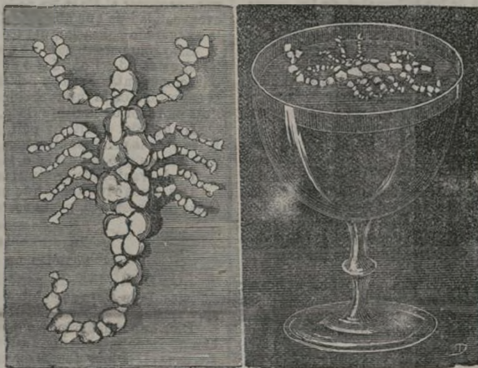
El escorpión de alcohol.

ridad antigua que dió á las épocas más decadentes artistas notables. Programas interminables esperan al alumno; profesores cuya palabra vacía de todo sentido trascendente, desespera á las almas jóvenes, ansiosas de penetrar con la razón y el sentimiento en los misteriosos secretos del arte, y ejercicios gráficos debilizantes, porque la inmundicia en los exámenes permite á los jóvenes esgararse cómodamente con respecto á su propia competencia, hacen que se desperdicie ese primer impulso del artista que le presta fuerzas para acometer los más rudos trabajos, se amague el estímulo que los grandes progresos infunden y se disipan los mejores y más decididos propósitos. Mientras tanto, lo inunda todo ese aire de facilidad que empuja á los jóvenes y las artes y cien-