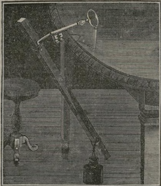
Centro de gravedad.

La comisión halló al capitán desmayado y no fué posible ver al cadáver de la desgraciada amante.