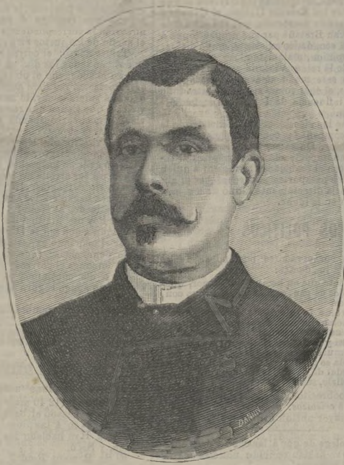
El aventurero Prado.

(El acusado explica que es comendador de Isabel la Católica y que ha sido gobernador de una provincia).