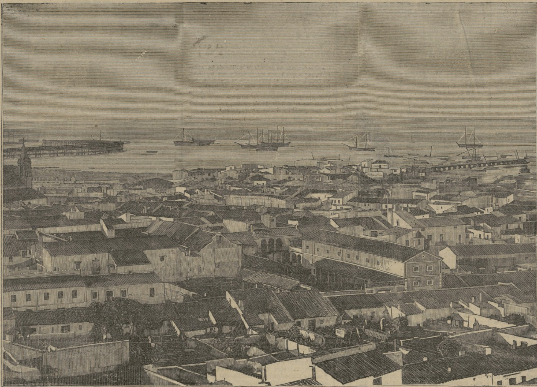
Ciudad y puerto de Huelva.

jeetnosas perspectivas del Norte, el mismo íntimo sentimiento de su poesía.