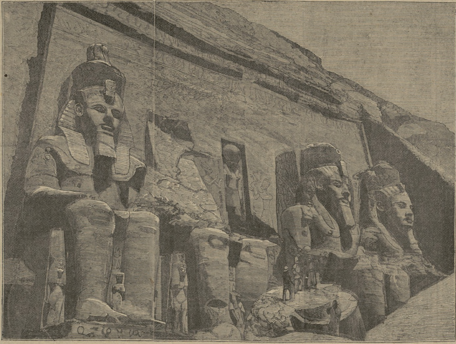
Fachada del gran templo de Abu-Simbel, en el alto Nilo.

las presas que pasaban á su alcance. La cola resultaba corta,—relativamente á su cuerpo—pero muy poderosa, y de una fuerza capaz de hacer zozobrar pequeñas embarcaciones, si es que por aquellas remotas edades hubiesen surcado los mares.