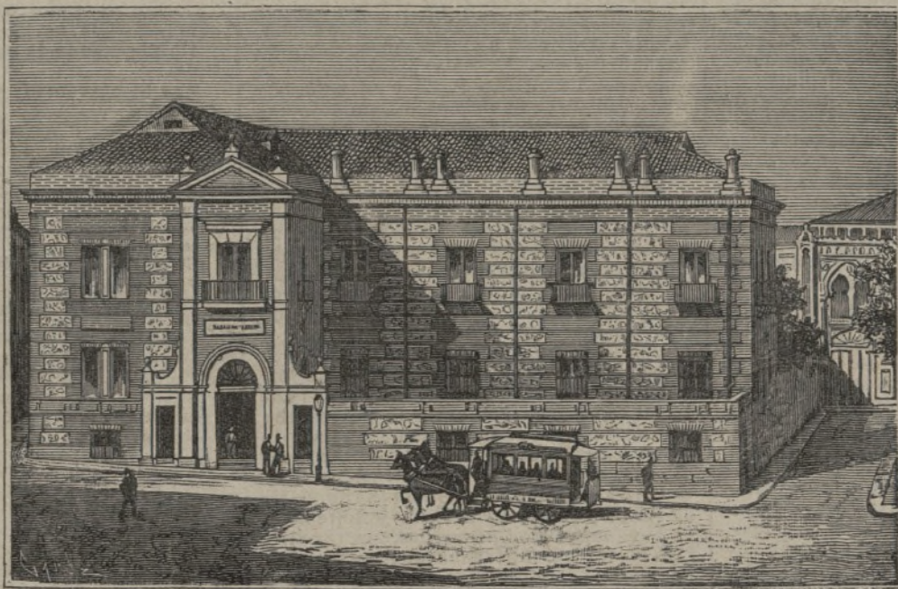
Banco de Castilla.

trasmigraciones según unos, órganos de la generación humana según otros; por los elementos nutritivos que sus granos contienen, por el suave aroma de sus flores, que sirven para blanquear y aun hermosear el cutis, merecen las habas lugar preferente en el mundo de los vegetales.