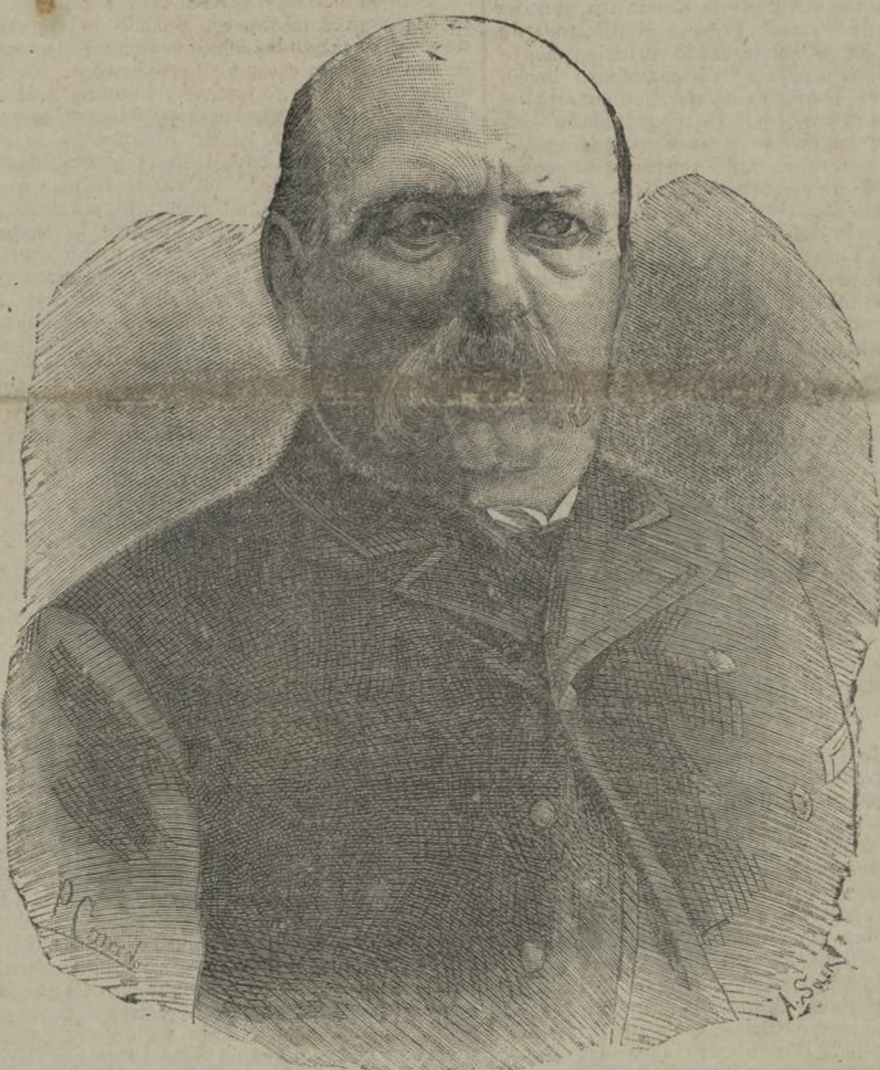
D. Manuel Becerra, ministro de Ultramar.

Además, no es esta, amigo mío, época para epopeyas homéricas, y aun cuando el poeta puede, como usted lo ha hecho demandar á tiempos más heroicos que el presente los asuntos de sus obras, el medio