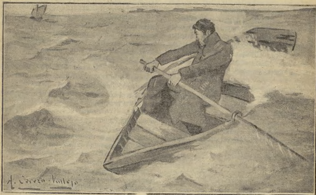
Vió una barca de velas rojas... (Pag. 30.)

Esto le proporcionó un verdadero consuelo, una provechosa distracción para su tristeza.