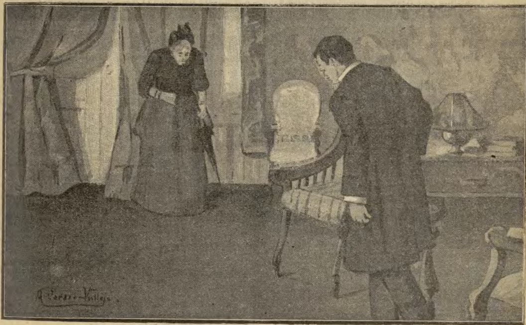
Se inclinó galantemente ante ella ..

Cuando la viuda salió del salón, el Marqués subió á sus habitaciones deseoso de contar á Ana la inve-