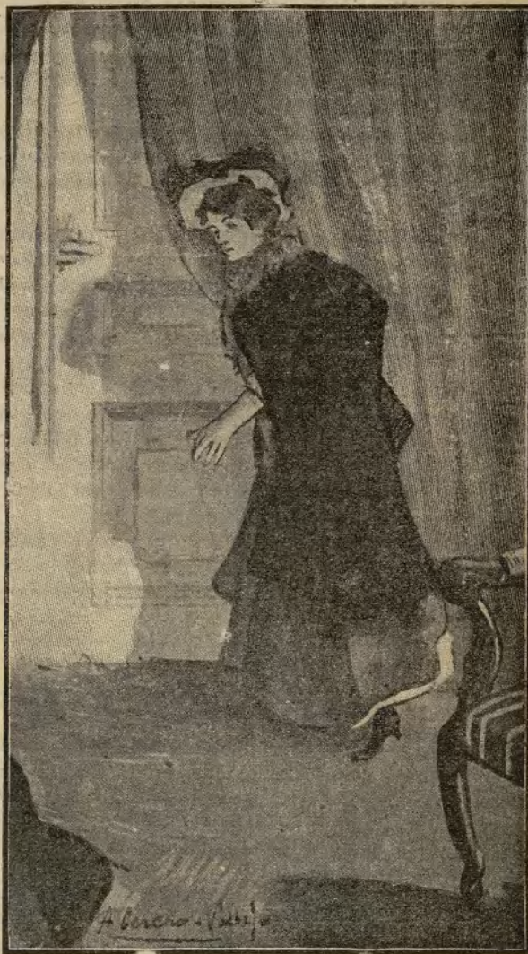
Le pareció que la voz de Luciano temblaba al responder. (Página 58.)

Con mucha dulzura, con las precauciones que emplean las madres al hablar á sus hijos, aludió al profundo amor de Pedro. Defendió la causa del marino con tal entusiasmo, que la joven se equivocó por un