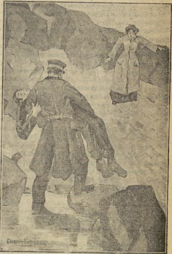
Llevaba en brazos al marino desmayado y herido... (P. 30.)

—Ya comprenderá usted, Juana—decía la joven,