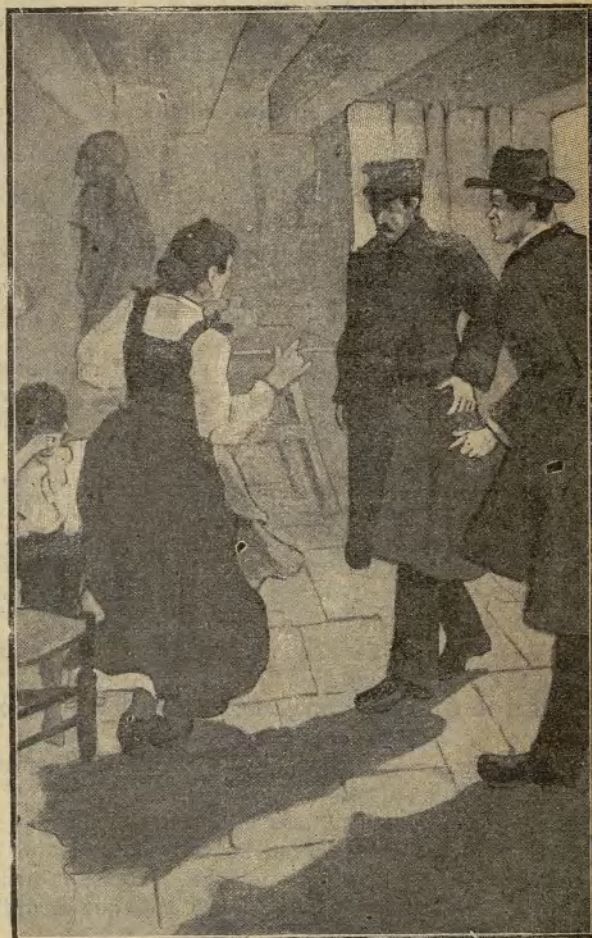
Contó que su marido, seducido por el dinero que Juana le había ofrecido .. (Pág. 28.)

Ibo y Ana habían observado su tristeza; pero Pedro disimulaba tan bien los sentimientos de su alma