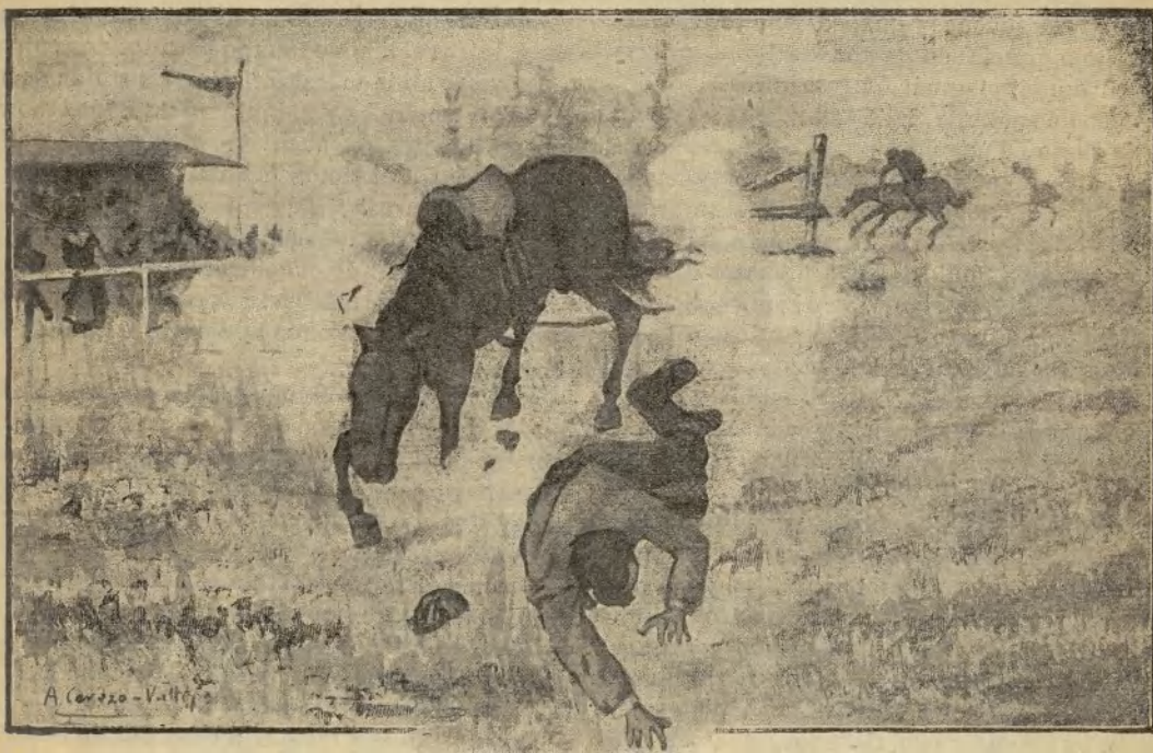
Uno de ellos, el preferido, se mató al saltar un obstáculo en el concurso hípico...

¿Cómo con semejante fortuna y—lo que aún vale más—con una belleza deslumbradora, Marta del Teste no se había casado á los veinticuatro años y medio; es decir, en vísperas de quedarse para vestir imágenes, oficio que tanto asusta á las muchachas?