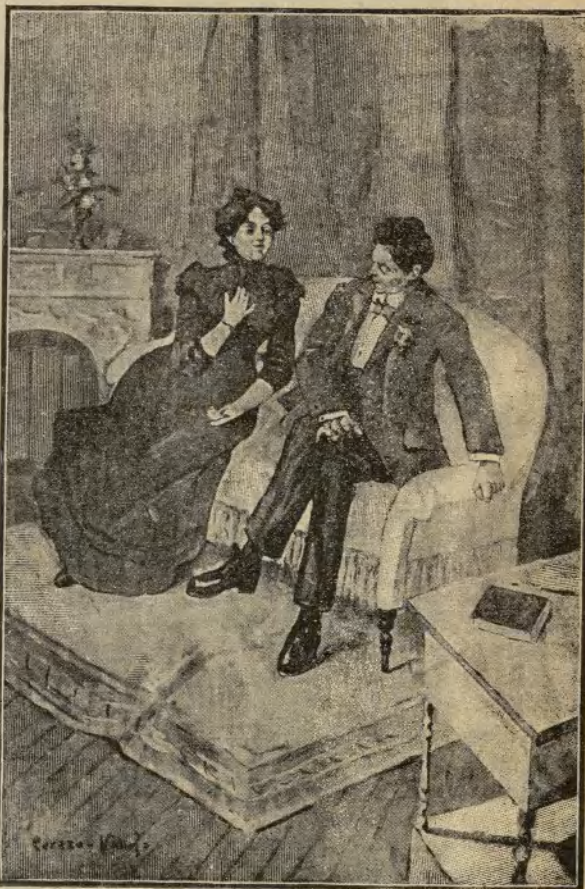
Soy tuya para siempre.

Tomó posesión de su marido; y cuando sus besos los reconciliaron para siempre, le dijo al oído, en