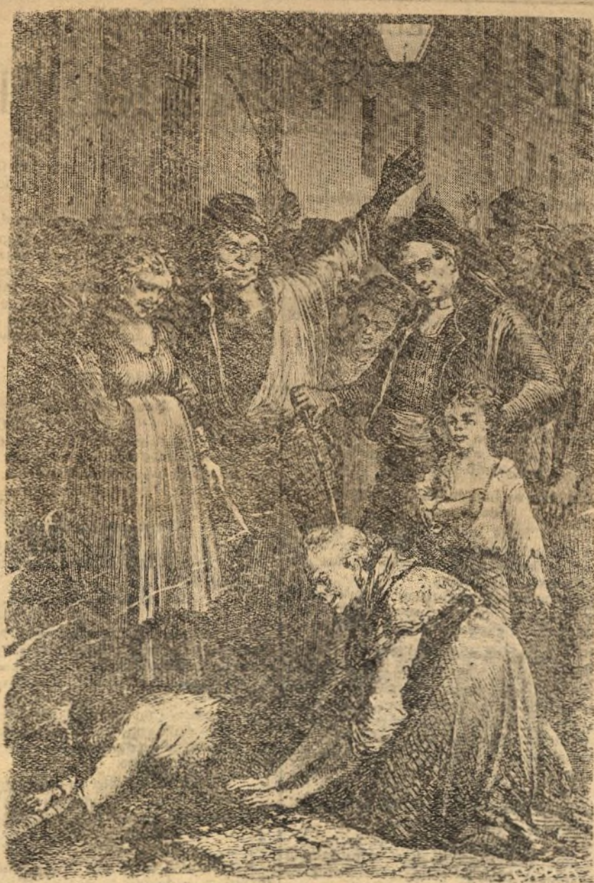
ASESINATO DEL GUARDIA RAURA