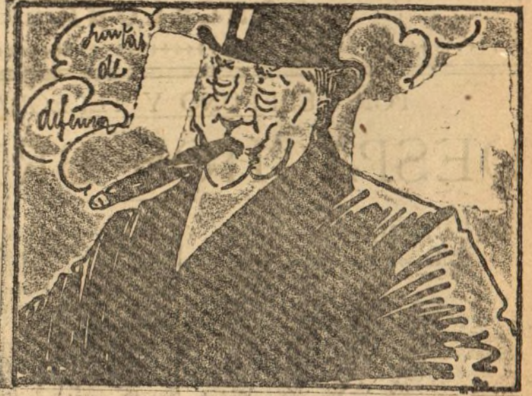
A Allende una fagarrina de muy mala nicotina.