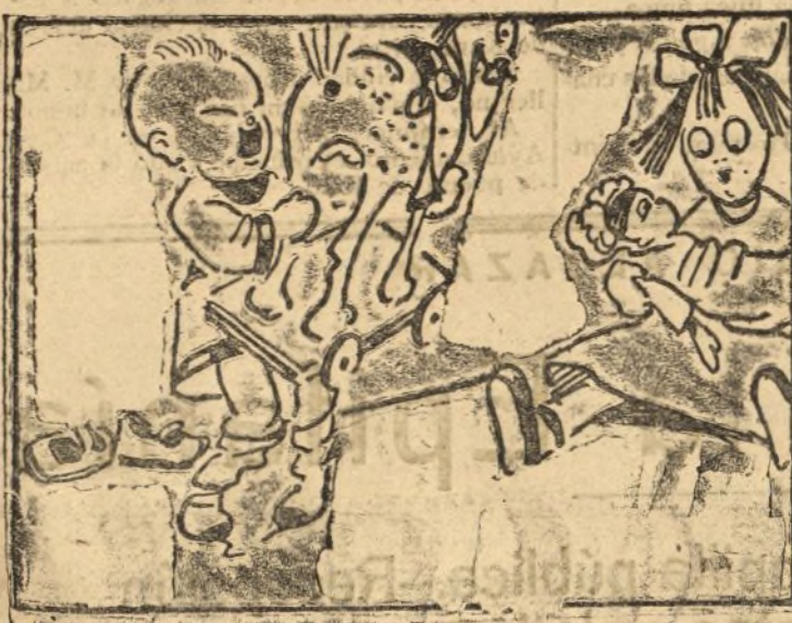
Uno caballo a Babieca y a la Coqui una muñeca.

Alaluyas de actualidad, por Lorenzo Aguirre