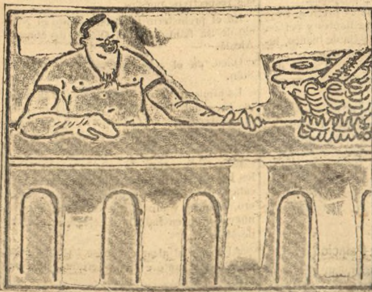
El fahonero Zenón pide una indemnización.