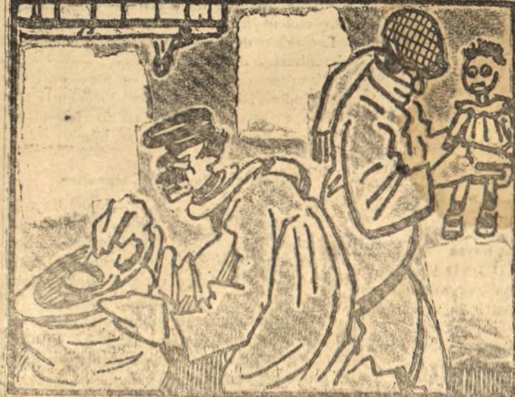
La asociación de mangantes sus hogueras antes.