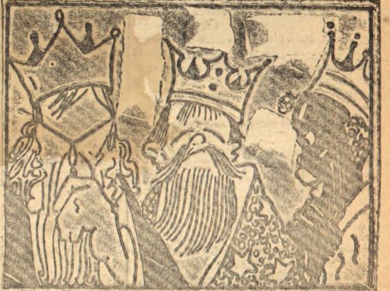
Los magos han cavillado pero en todo han acertado.