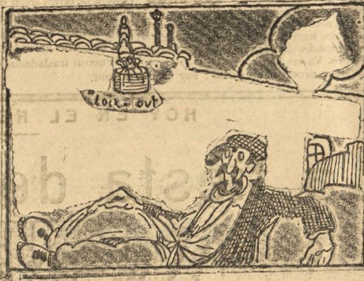
Al sindicalista obrero el cocido en el alero.