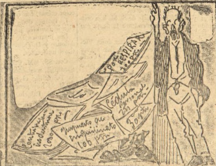
Al pobre contribuyente cargas hasta que levante.