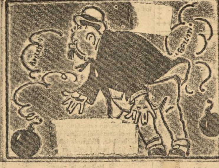
Al patrono danle un susfo bombeándole a su gusto.