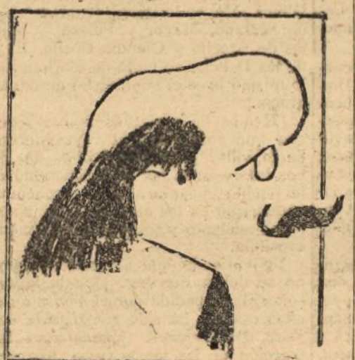
(Caricatura de Edmond Rostand, por SEM).

Hemos de consignar aquí, por nuestra cuenta, que este afortunado sentido de mesuración, exento de «geniales» estridencias, pero limpio también de errores y defectos absurdos, que caracteriza la modalidad o temperamento artístico de Díaz de Mendoza, la crítica lo ha interpretado siempre mal, y a nuestro entender no ha hecho todavía un ecánime y sereno juicio definitivo que sitúe-