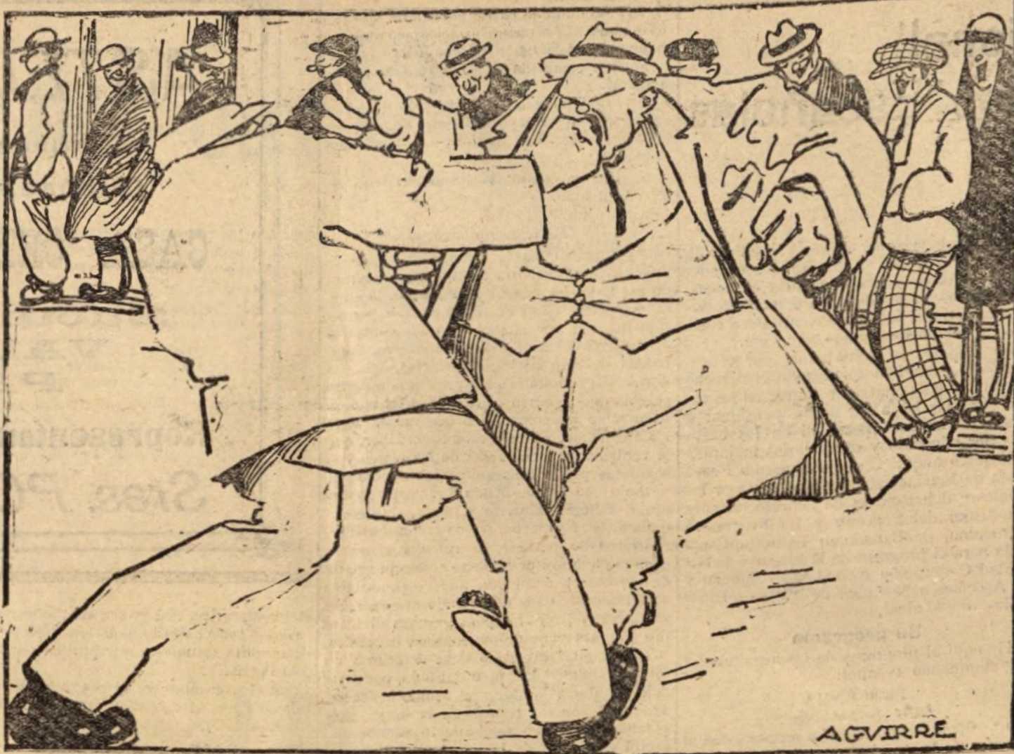
En los tiempos de escasez — el reñir es muy sencillo, unos defienden su honor — y los otros un pitillo.

—La condesa de Almaraz se halla restablecida de su enfermedad.