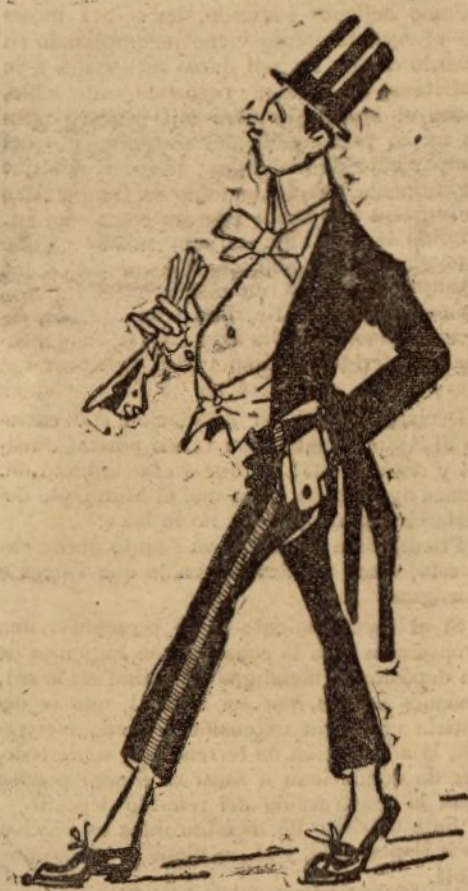
El de Villatobas.

Al llegar al final de esta larga excursión coreográfica, que no sé si tú, amabilísimo lector, habrás tenido paciencia para acabar. Nos quedan por recorrer los cabarets a la parisién, los restaurantes de noche tan en boga en el extranjero, que