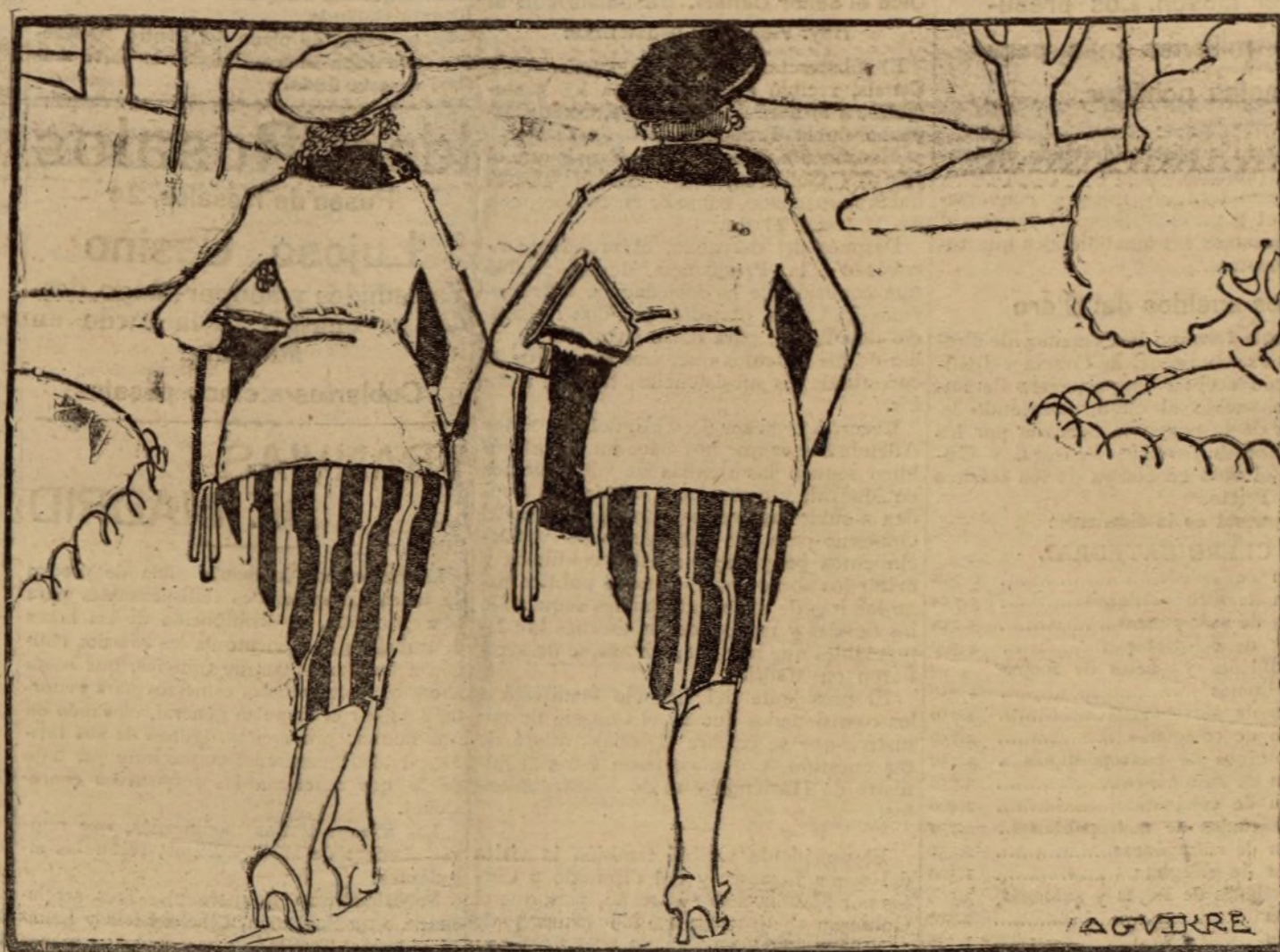
MADRE E HIJA.—¿Cuál es la madre y cuál la hija?