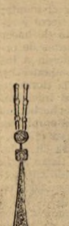
Pendient con tres brillantes y rosas. Número 2.896. Pesetas 400.