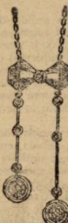
Pendient con tres brillantes y rosas. Número 2.882. Pesetas 375.