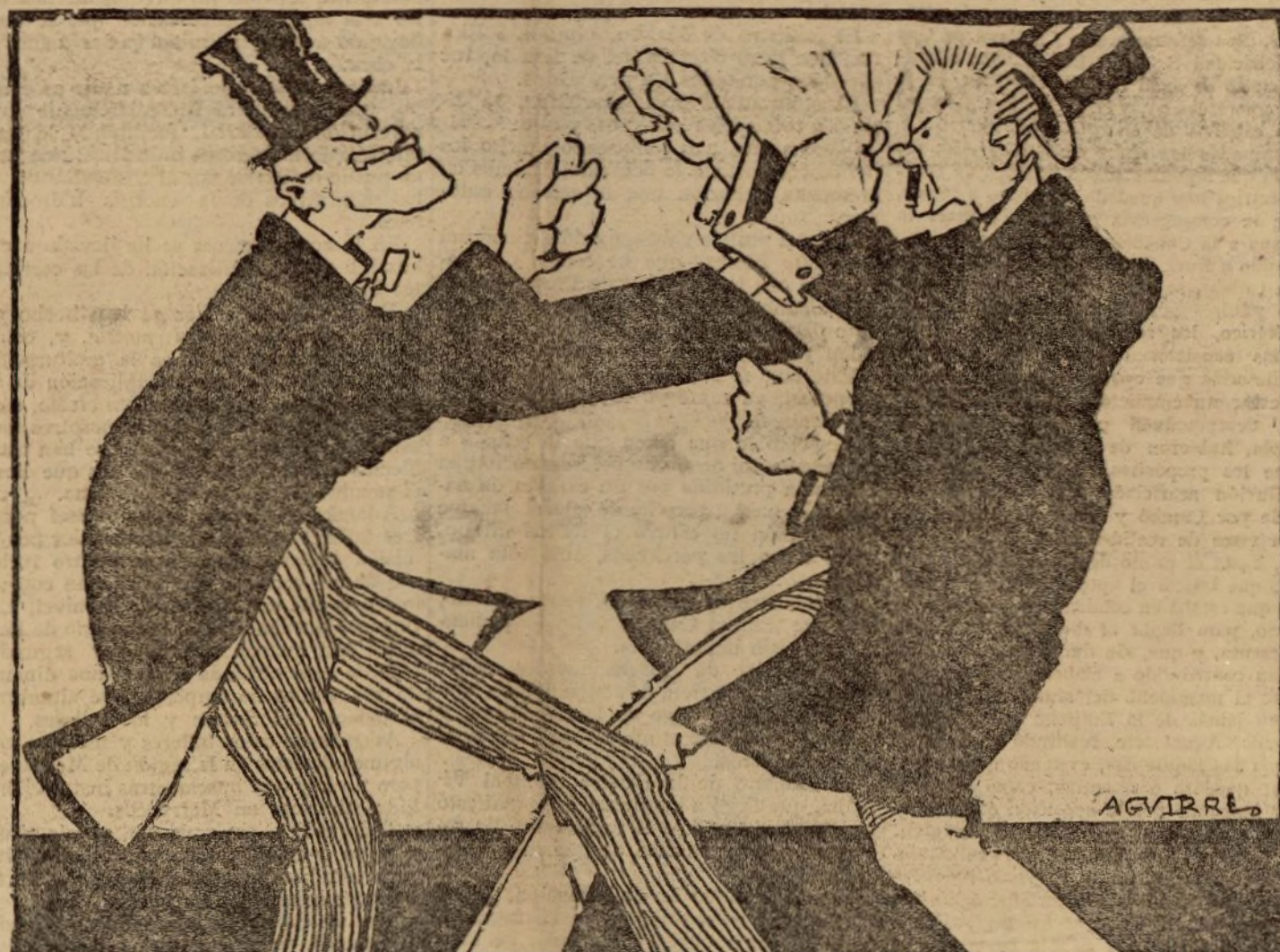
Artículo 19.—Las Cortes se componen de dos Cuerpos Colegisladores, "iguales en facultades"...