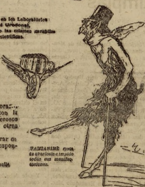
VAMIANINE cura la avariosis en todas sus manifestaciones.

Exigir la marca depositada: EL HOMBRE DE LAS TENARAS.