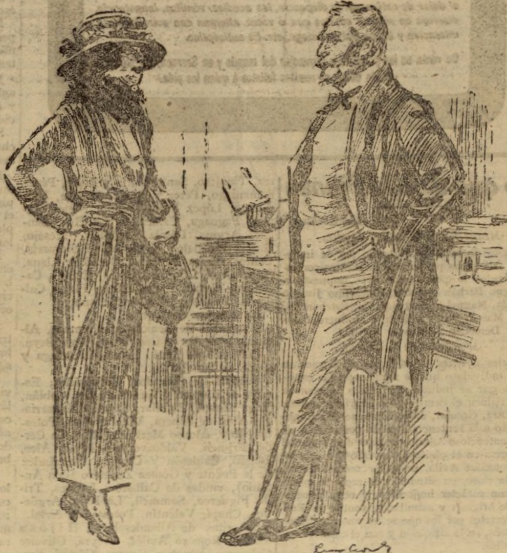
—La mamá desea hablarte de nuestros trajes de primavera... —Dile que yo también tengo que hablarte de la primavera... ¡Pero de otra primavera!