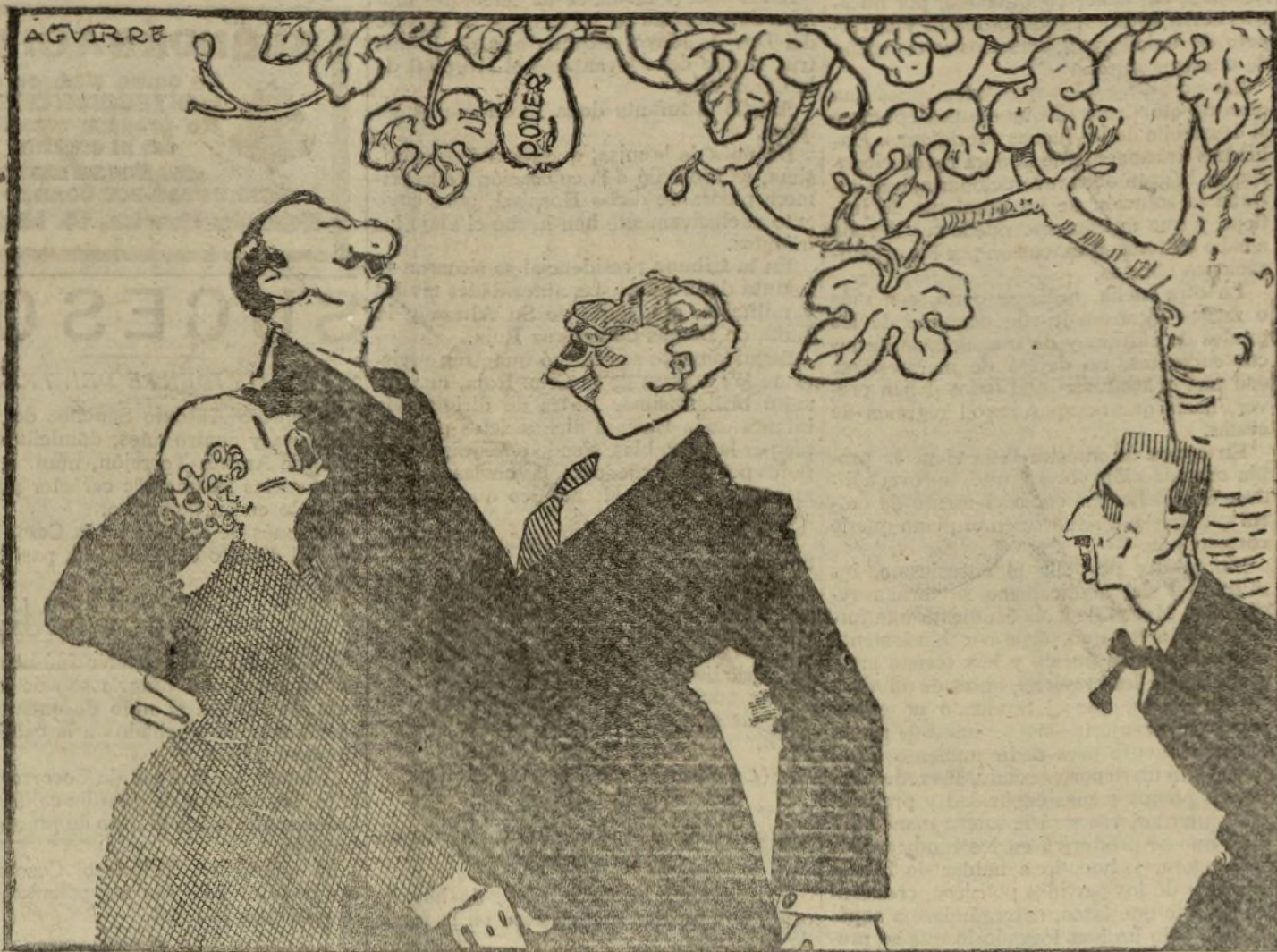
LO QUE AGUARDAN TODOS