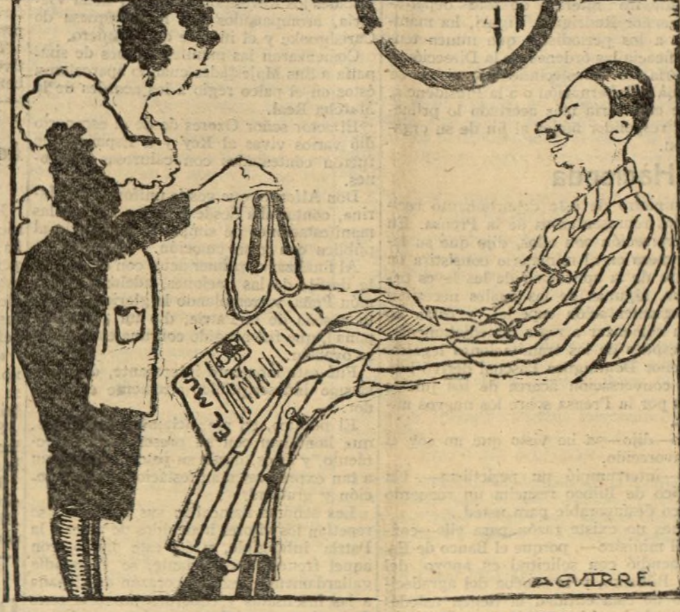
—SEÑORITO!... EL ALPARGATERO HA TRAIDO ESTO PARA USTE!