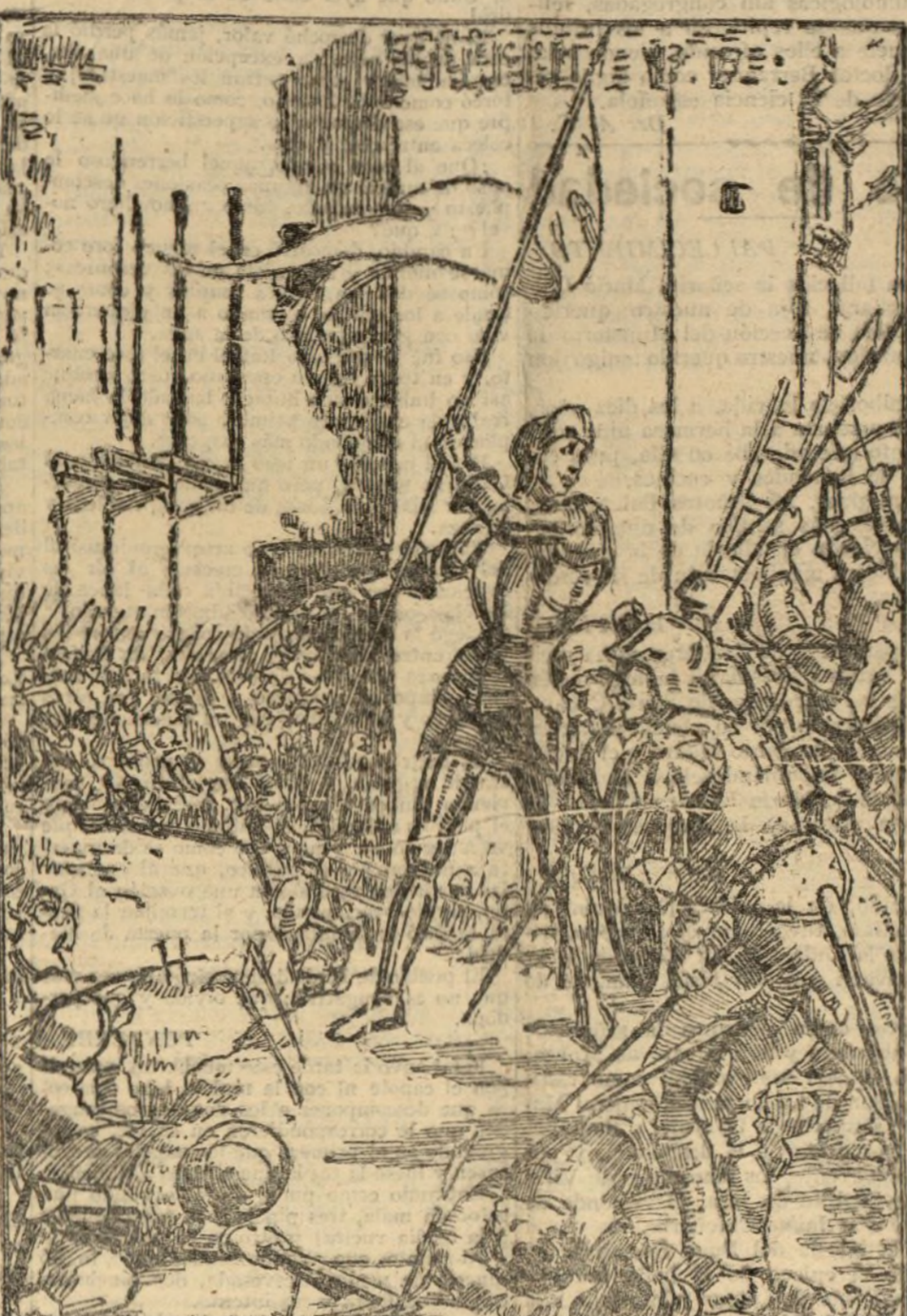
UNA NUEVA SANTA

JUANA DE ARCO ANTE LOS MUROS DE ORLEANS (De un fresco, por Lapvannu).