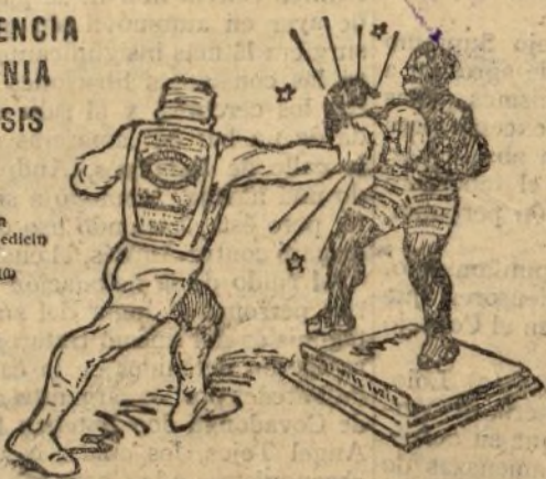
GLOBÉOL permite el máximo de esfuerzos

Tónico vivificante abrevia la convalecencia, aumenta la fuerza de vivir.