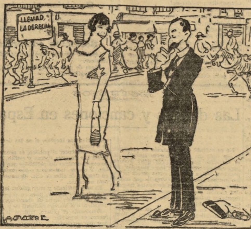
—Paseo o lo paseo