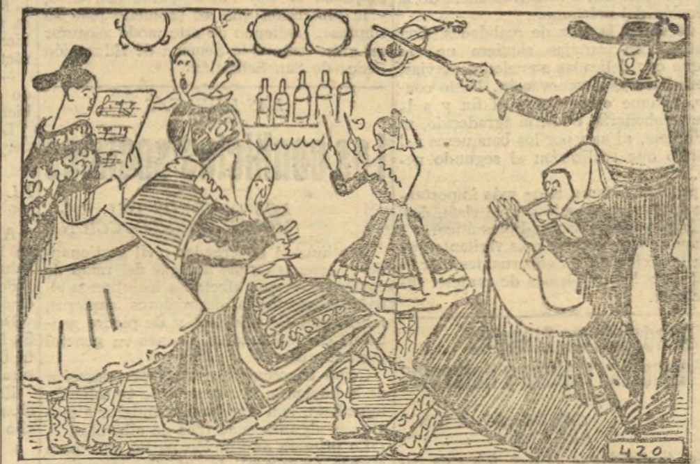
ZUBIAURRE.—El sexteto de Langarera.