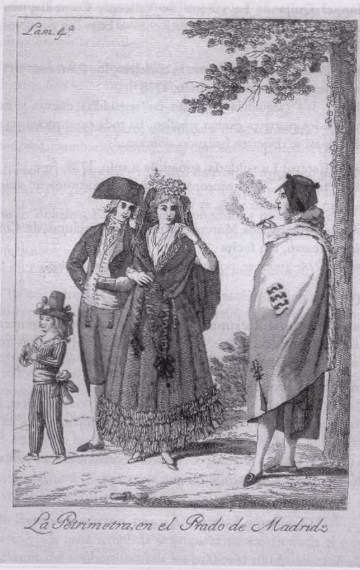
La Petrimetra, en el Prado de Madrid