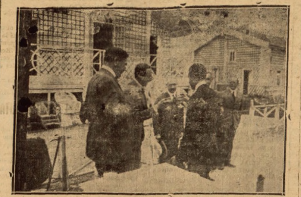
EL REY BRINDANDO CON EL INFANTE DON ALFONSO, POR EL TRIUNFO OBTENIDO POR ESTE EN EL TIRO DE PICHÓN.

jante a la del hombre, con un mínimum hacia las cuatro de la mañana y un máximo hacia las cuatro de la tarde. Esto parece indicar que el ritmo térmico del hombre sería resultado de la persistencia de un fenómeno ancestral que tiene su origen en lo dicho. En el mismo Congreso el sabio físico, Mr. Verronnet, muy conocido por sus estudios sobre el sol, presentó también un trabajo muy interesante, según el cual la temperatura del sol es de 6.000 grados, o sea el doble de la temperatura del arco volcánico. Según Mr. Verronnet hace ciento cincuenta mil años la temperatura de la tierra era once veces más elevada que hoy, y, por lo tanto, el globo terrestre, según esta teoría, dentro de sesientos mil años se verá recubierto de hielo. Claro está que va a sernos un poco difícil de comprobar estos estudios, pero lo que sí se puede afirmar, desde luego, es que el sabio Verronnet es un calculista de cuidado. Dr. A. C.