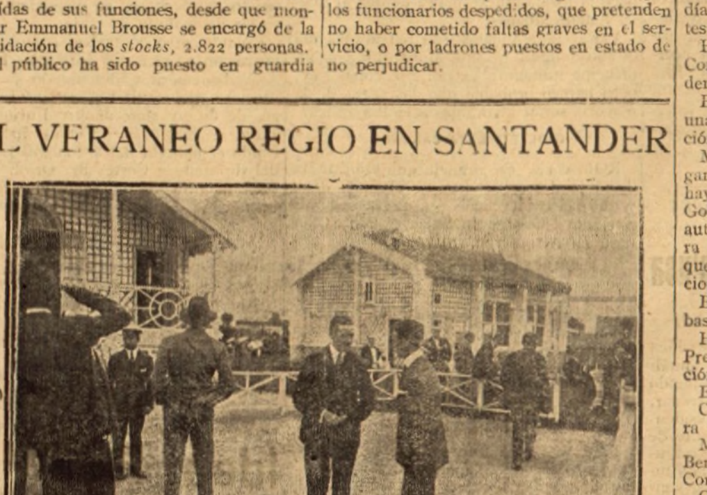
SU ALTEZA REAL EN INFANTE DON ALFONSO, QUE GANO LA COPA DE DON CARLOS EN EL TIRO DE PICHÓN.