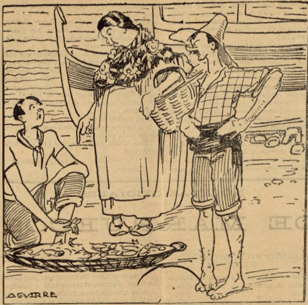
—¿CHE, ¿QUE VALEN LOS SALMONETES? —SINCO PESETAS «LLIURAS». —¿QUESUS! ¿THAS CREIDO QUE SOY MADRILEÑA?