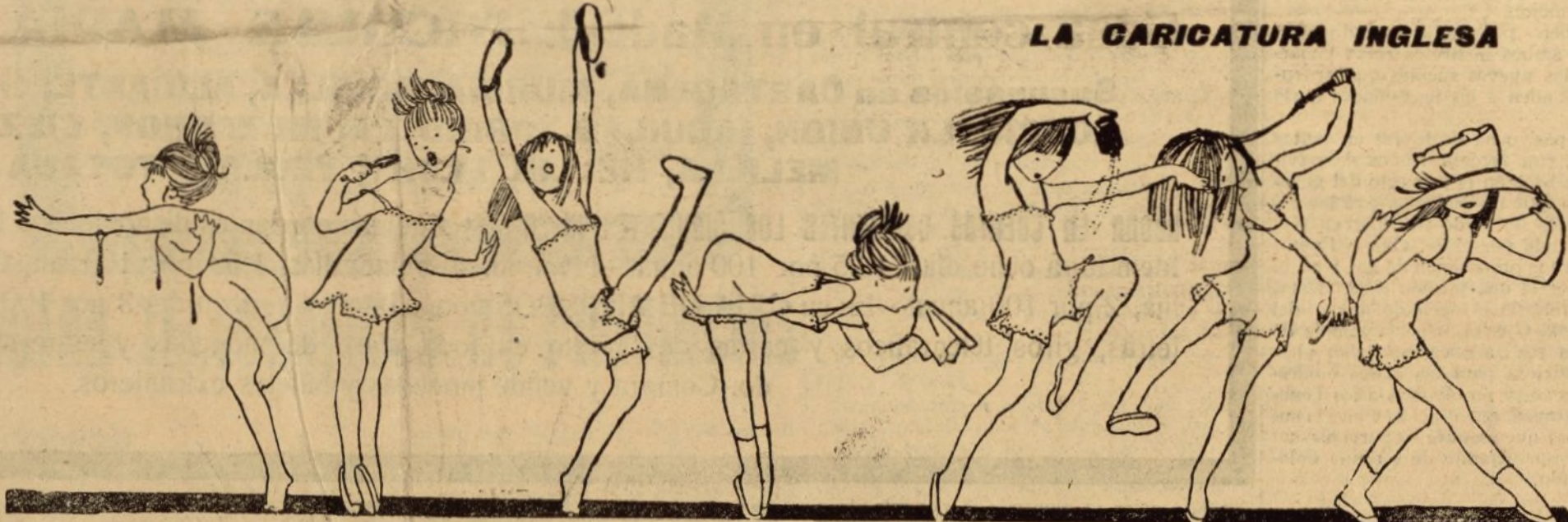
LA DANZA DE LA TOALETA