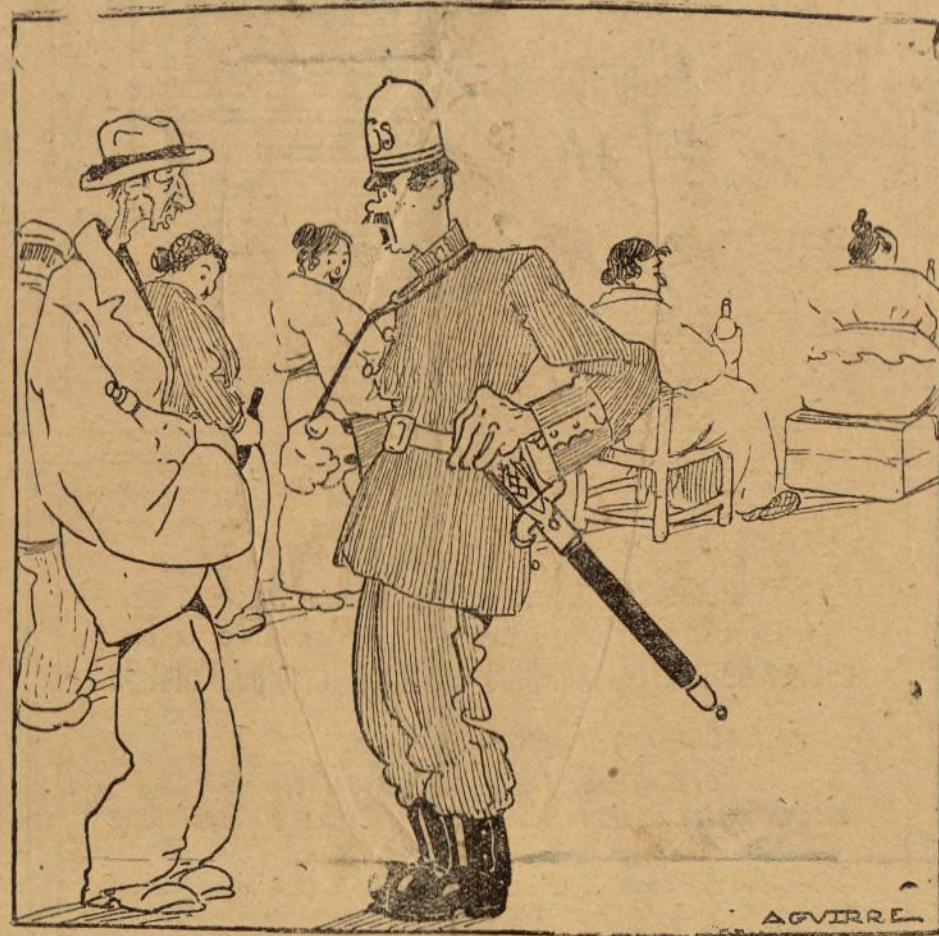
—¿Y CUANTO TIEMPO LLEVA USTED AQUI? —VEINTISIETE DIAS. UNO MAS QUE EL ALCALDE DE CORK.